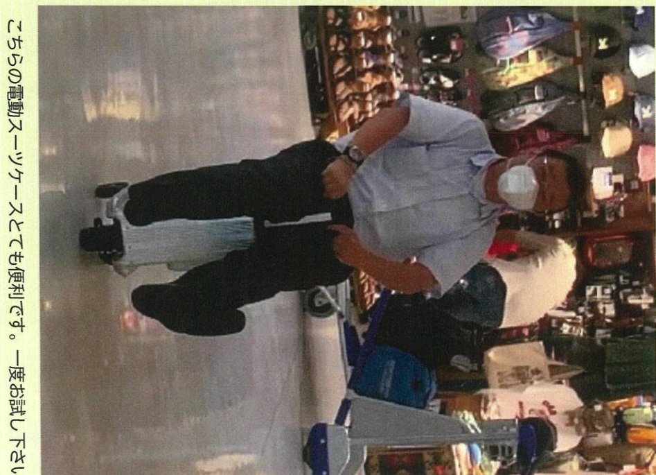
こちらの電動スクーターとても便利です。一度お試し下さい。

高齢者入浴アドバイザー及び認定講師、温泉入浴指導、サウナ、スパアドバイザーの資格取得しました。旅行業とは別でご案内することが可能です。最近流行りの「整う」もお任せください。